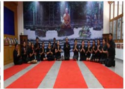
แหล่งเรียนรู้ภายในสถานศึกษา ห้องพุทธทาสศึกษา วิทยาลัยการอาชีพไชยา