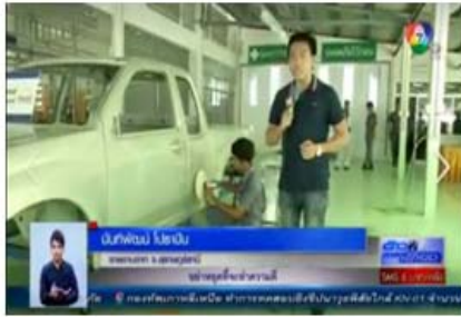
สาขางานตัวถังและสีรถยนต์ ได้รับการเผยแพร่ ออกอากาศ ทางสถานีโทรทัศน์กองทัพบกช่อง ๗