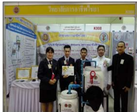
รางวัลชนะเลิศ สิ่งประดิษฐ์ ระดับชาติ