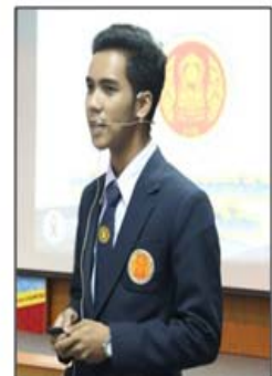
นักศึกษา รางวัลพระราชทาน

วิทยาลัยการอาชีพไชยา สำนักงานคณะกรรมการการอาชีวศึกษา กระทรวงศึกษาธิการ