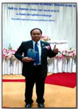
สถานศึกษาต้นแบบ การลดปัญหาการออกกลางคัน