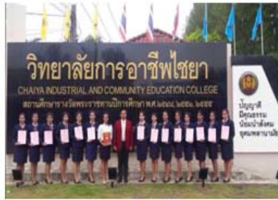
เชิดชูคนดีและคนเก่ง วิทยาลัยการอาชีพไชยา